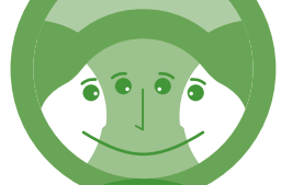
Tableau “processus de paix” pour l’élève