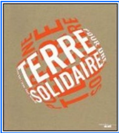
Collection "Beaux rivages" - Cherche Midi Editeur 256 pages - 29 euros

Attention, vous pourriez ne pas le remarquer. Rien n'indique sur sa couverture que c'est le livre du cinquantenaire, et qu'il émane du CCFD, les voies du marketing sont parfois impénétrables ...Vous le trouverez du côté des beaux livres, car c'est un beau livre, Beauté plastique, d'abord, d'un papier épais, dos cousu visible, illustré d'affiches, de portraits, de dessins, de peintures... Mais aussi beauté intérieure, Une rapide traversée à travers ces cinquante années qui ont vu le CCFD se transformer pour vain-