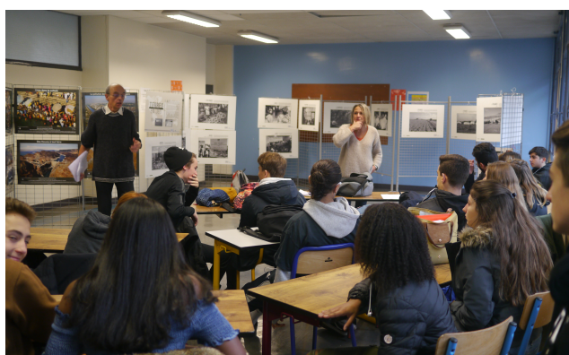
Visite guidée et interactive des expositions sur l'accaparement des terres et de l'eau dans le monde.

Après évaluation, le proviseur nous a demandé de mettre en place une organisation du même type pour l'année 2019.