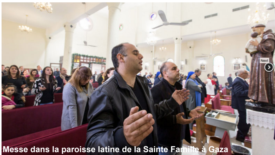
Messe dans la paroisse latine de la Sainte Famille à Gaza

***lors de la rencontre du 8 juin 2014 en la solennité de la Pentecôte au Vatican entre le Président de l'État d'Israël, Shimon Peres et le Président de l'État de Palestine, Mahmoud Abbas.