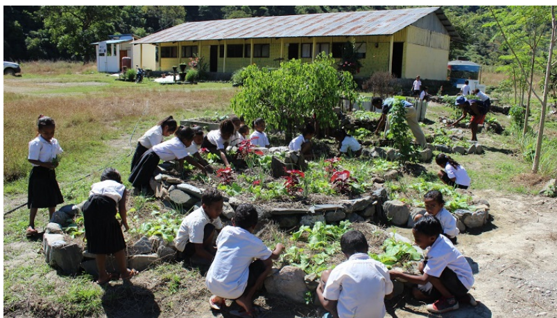
Camp d'enseignement de la permaculture

Permatil , est créé en 1999, lorsque les Indonésiens quittent le Timor Leste. Pour faire face aux crises alimentaires récurrentes, Permatil développe la permaculture/agroécologie, utilisant des variétés locales, adaptées à des sols pauvres en matière organique et nécessitant peu d'eau. Permatil fait partie du réseau TAPSA , (Transition Agroécologie Paysanne au service de la Souveraineté Alimentaire) soutenu par l'Agence Française de Développement.