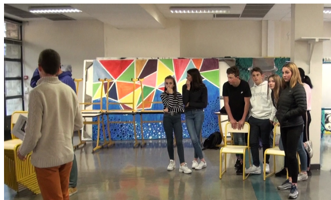
Jeu des chaises, l'Afrique : 16% de la population mondiale mais 3% des richesses.