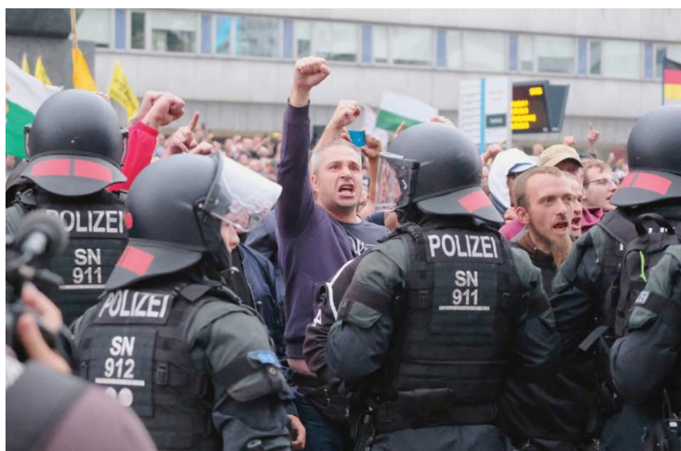
la manifestation du lundi 27 août 2018 qui a réuni 6 000 personnes d'extrême droite dans les rues de Chemnitz, à la suite de la mort d'un Allemand dans une bagarre avec les réfugiés le 26 août.