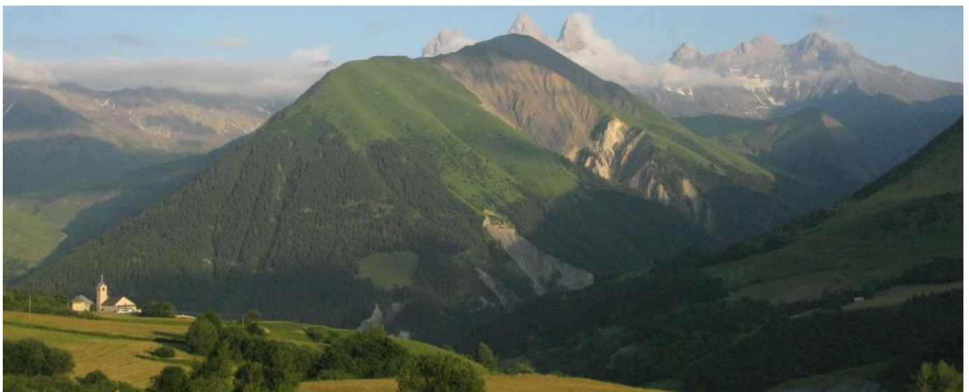
Vallée d'Arves - Haute Savoie