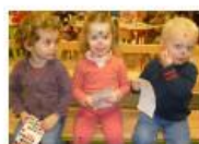
Le jeu de la gomette

Actuellement 20 jeux sont disponibles dans la rubrique outils d'animation. Cette rubrique va encore s'enrichir grâce à des jeux fournis par la délégation ccfd du 06. Rendez-vous donc sur :