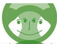
Des choix pour la paix