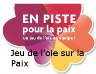
Jeu de l'oie sur la Paix