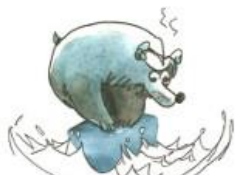
Les ours polaires

Le nombre de jeux disponibles sur votre site a considérablement augmenté. Quelque soit le public visé vous devriez pouvoir trouver de quoi animer une séance d'une façon ludique.