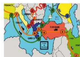
En route avec les migrants