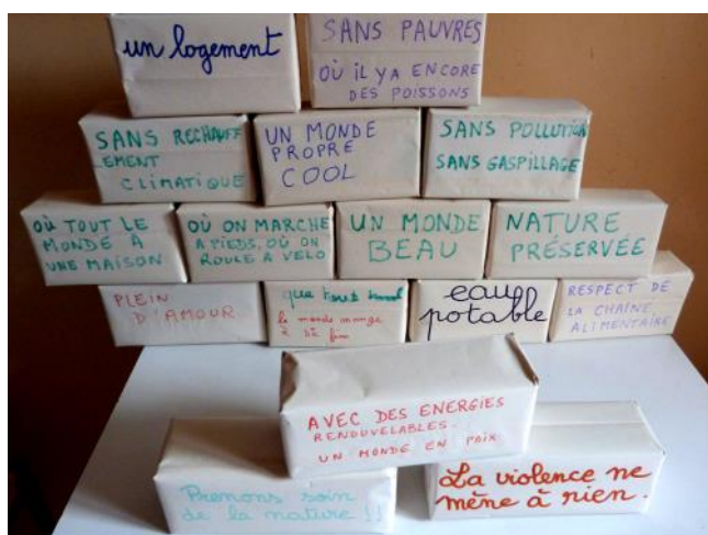
Le Monde que les enfants veulent construire

Pendant toute la semaine, les classes se sont succédées ainsi qu'un grand groupe de KT. Au total 436 enfants ont visité cette exposition. Ils ont découvert que "Le Développement Durable", c'est aussi leur affaire. Ils peuvent agir à leur niveau. Ils ont regardé des dessins animés sur la manière dont fonctionne la nature et pourquoi il faut éviter de la dégrader, puis guidés par un animateur ils ont compris qu'avec des petits gestes comme le tri sélectif, ils pouvaient contribuer à sauvegarder l'environnement.