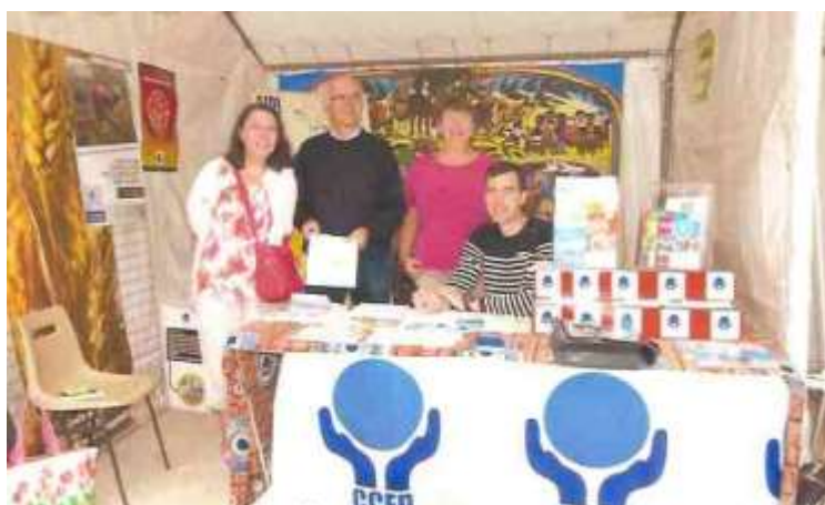
Équipe CCFD Versailles journée des associations 2015