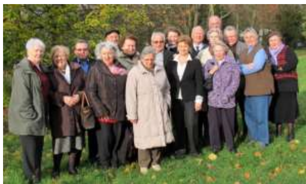
Le comité diocésain du MCR des Yvelines (2011 / 2012)

Par exemple, après Alençon et Notre Dame de Montligeon en 2013, nous irons à Nevers du 13 au 15 octobre 2015.