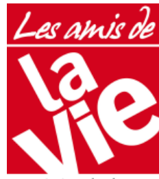
Association des lecteurs

La Paroisse de Plaisir et les Amis de La Vie des Yvelines vous invitent à une Conférence débat