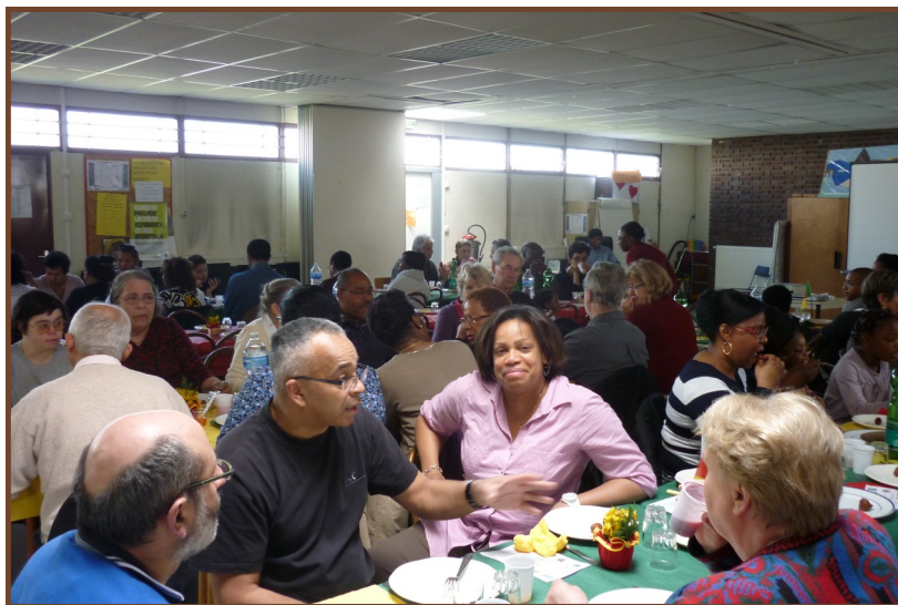
Repas à Gargenville

« Si j'avais entendu cela avant (la catéchèse sur la solidarité), j'aurais parlé autrement aux enfants. » dit cette Catéchiste.