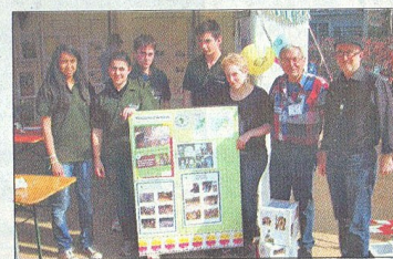
◆ Les élèves de Tecomah se mobilisent pour l'eau potable en République du Congo.

Un château d'eau La région de Tali Payam a ainsi été choisie par l'association "CCFD Terre Solidaire" pour creuser des puits et apporter une eau de qualité, destinée aux hommes comme au bétail. Une exposition retraçait