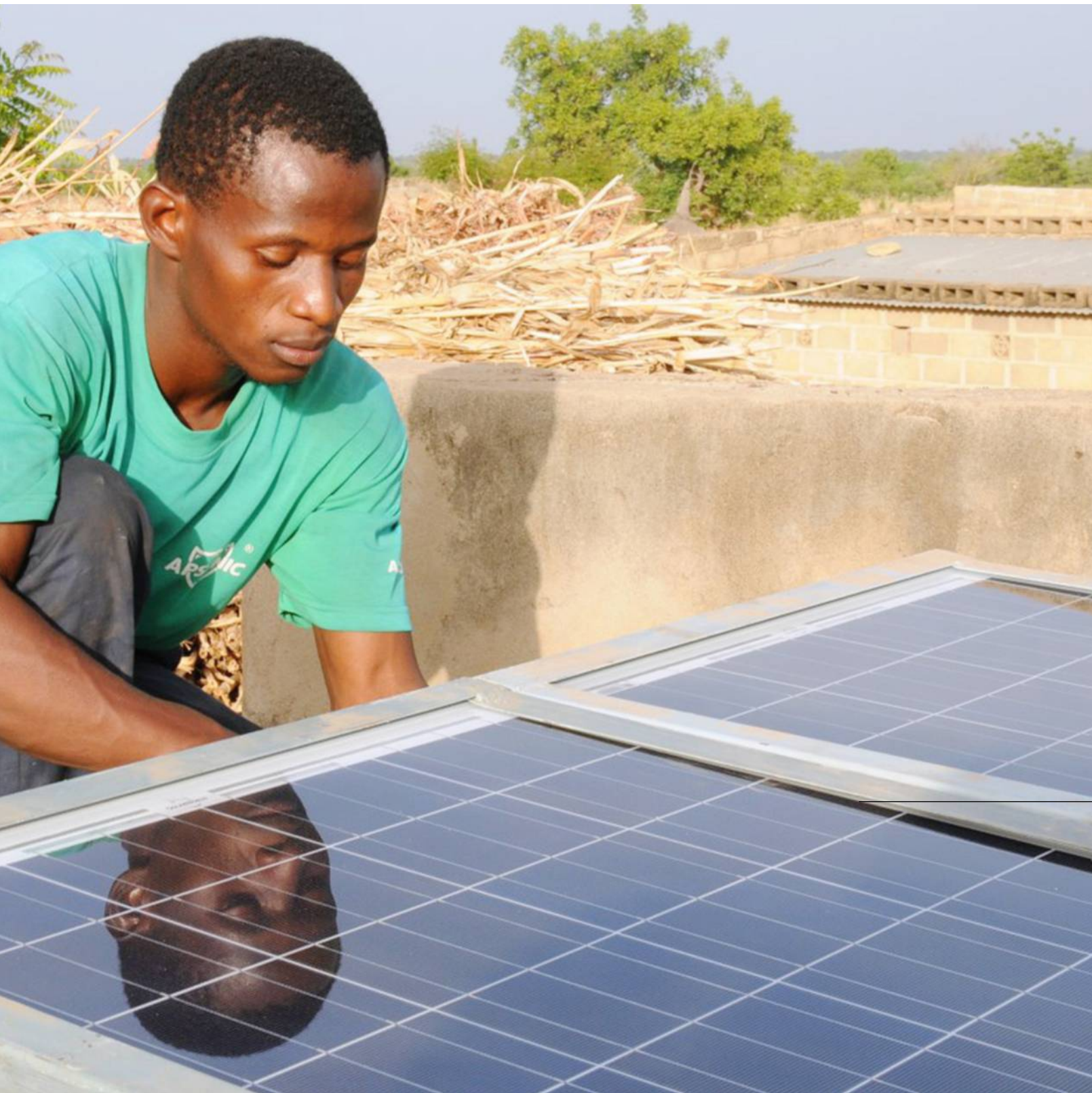
Installation d'un système solaire du programme Micresol par un technicien burkinabé. Fondem

«Quand on conçoit un projet comme celui du maraîchage au Sénégal, il faut tout regarder: quelle est la quantité d'eau requise? Qui sera chargé de l'infrastructure électrique?»