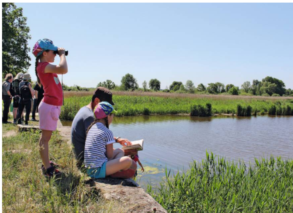
La réserve naturelle régionale des Étangs de Belval-en-Argonne (Marne).

Pour accomplir ses missions, le conservatoire, de statut associatif, jouit d'un budget de 2 millions d'euros par an, couvert à 75 % environ par des subventions de la région, de l'État, des agences de l'eau et de l'Europe. Le reste est assuré par des prestations de marchés publics pour