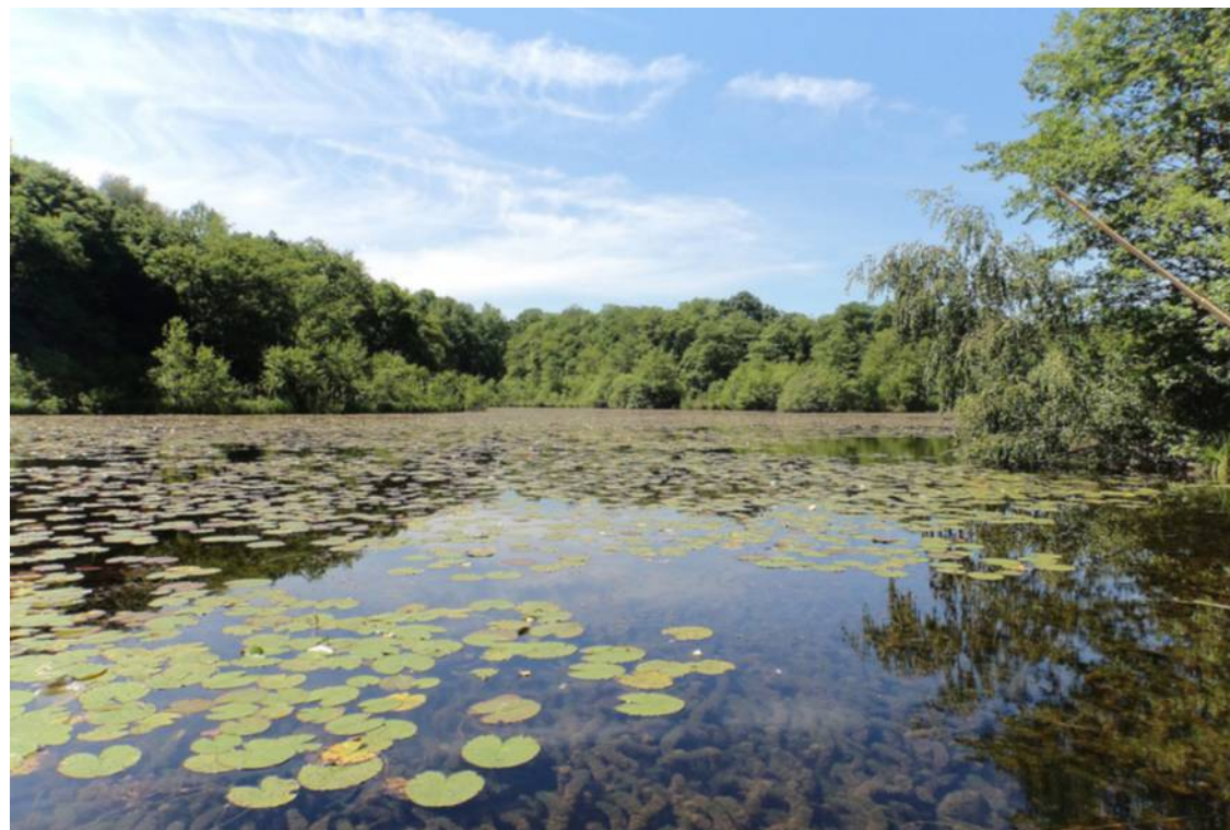
Le conservatoire d’espaces naturels de Champagne-Ardenne protège et valorise des sites comme l’étang de la Grande Rouillie (Marne). CEN Champagne-Ardenne

L’an dernier, les encours de l’épargne solidaire ont battu des records, dépassant le seuil des quinze milliards d’euros. Les Français misent sur la transition écologique.