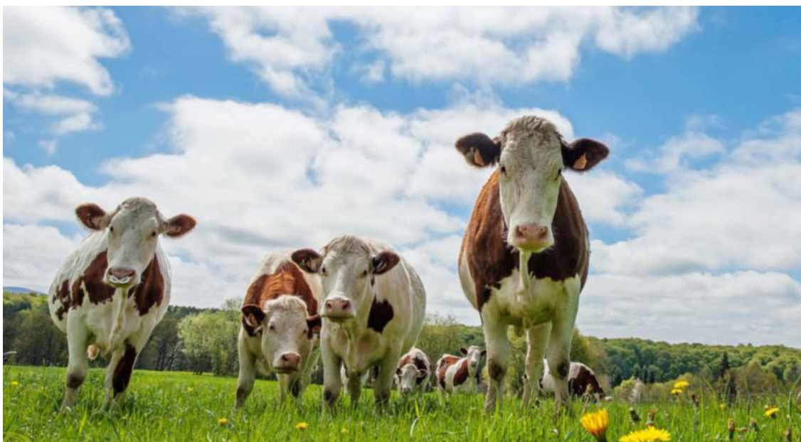
Une coopérative aide qui au développement des territoires ruraux.

« J'étais essoré psychologiquement, prêt à arrêter ma carrière », lance Marc (1), un agriculteur des Côtes-d'Armor, qui préfère garder l'anonymat pour ne pas faire étalage de ses difficultés. L'an dernier, cet éleveur de bovins de 38 ans au bord de la faillite est parvenu à « sortir la tête de l'eau » en signant un contrat avec la coopérative Terrafine.